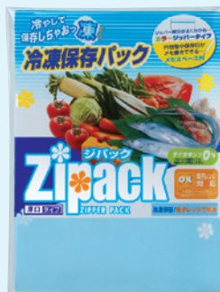
KK-010 ジパック・冷凍保存パック3枚