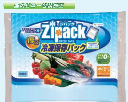
PK-005 受注生産品 ビロージパック・冷凍保存パック3枚