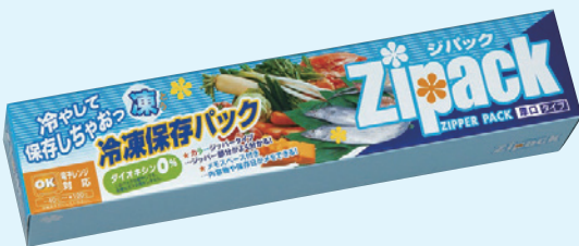
KK-004 ジパック・冷凍保存 BOX5枚